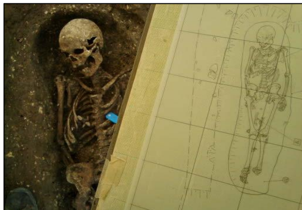
Zakresľovanie kostrového hrobu zo stredoveku

Pri svojej práci v archeológii využíva skúsenosti z predmetov ako technické kreslenie, ktoré mal na