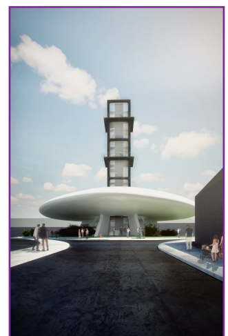
/Prešovská vodárenská veža včera a za chvíľu dnes./