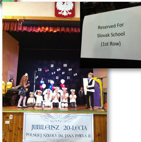
▲ Oslávili sme s našimi poľskými priateľmi 20. Výročie založenia školy Jána Pavla II. V Albione.