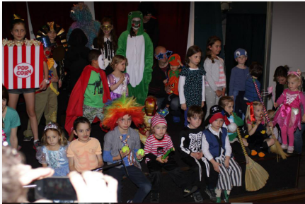
◀ Karneval v Sokol Národný dom spolu s Českou školou Melbourne – 12.9.2013