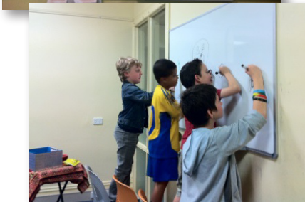
▲ Učili sme sa v triede...