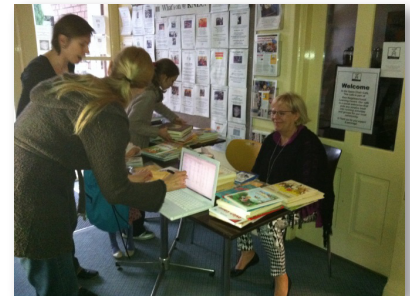
▼ Otvorili sme knižnicu.